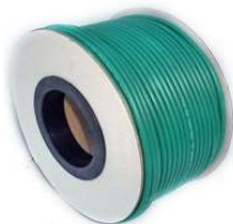
Ref : KX6-1 Câble coaxial KX6 – 75 ohms, 100m.