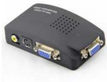
Ref : CS03

Convertisseur VGA / BNC / SVIDEO. Configurable via menu OSD. 2 VGA, 1 BNC, 1 SVIDEO.