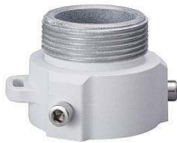
Ref : PFA111 Base support pour dome Dahua.