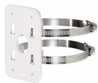
Ref : BASD02